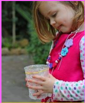
HOW TO MAKE A MICROSCOPE GOOD SCIENCE FOR KIDS